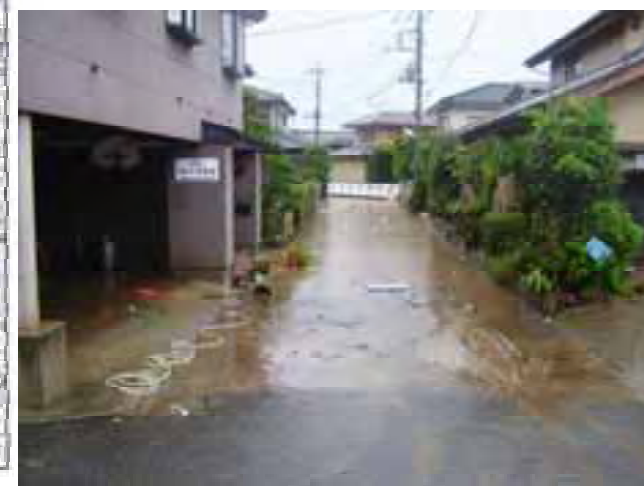
曾木地区浸水状況